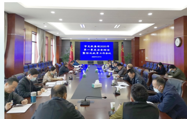
集团召开2020年第一季度安全综合暨防汛抗旱工作会议