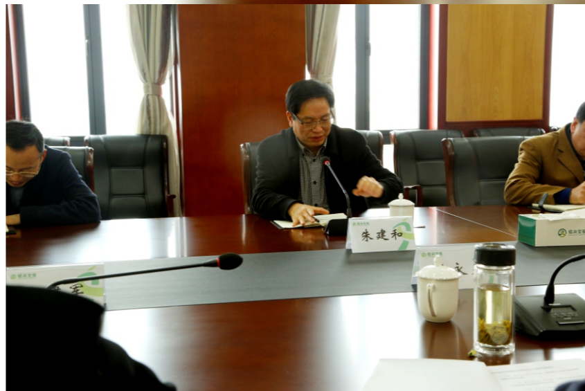
市委第三巡察组向市交投集团党委巡察情况反馈会