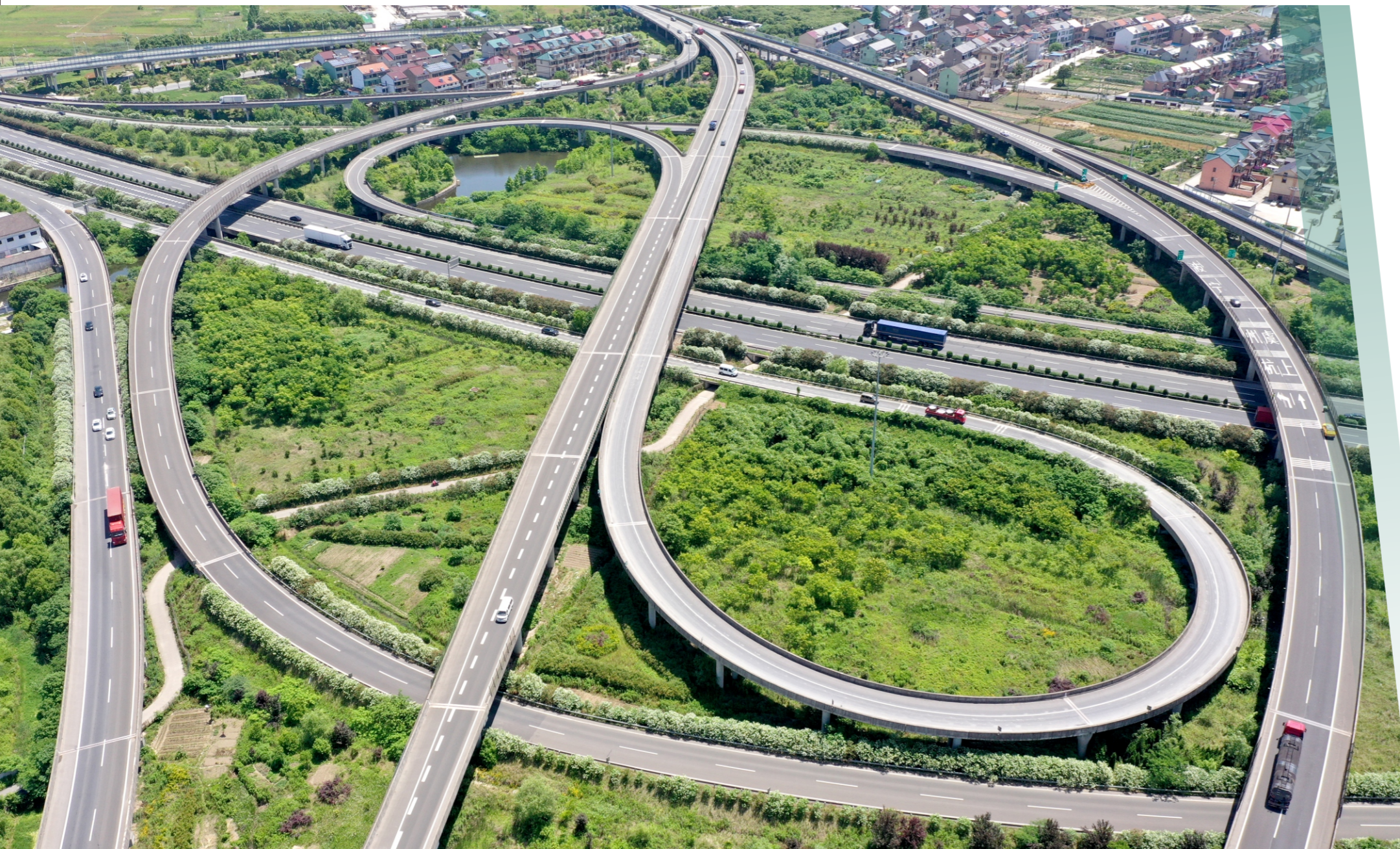
常台高速与绍诸高速交汇上虞枢纽道墟互通

警示牌36块；提高技防，互通匝道和主线隔离区实施电子探头24小时全方位监控，加强全国路网联调联动，目前已优化机电系统9次，ETC天线和车牌抓拍识别率达98%以上，收费、监控等机电系统维保完好率均在97%以上。