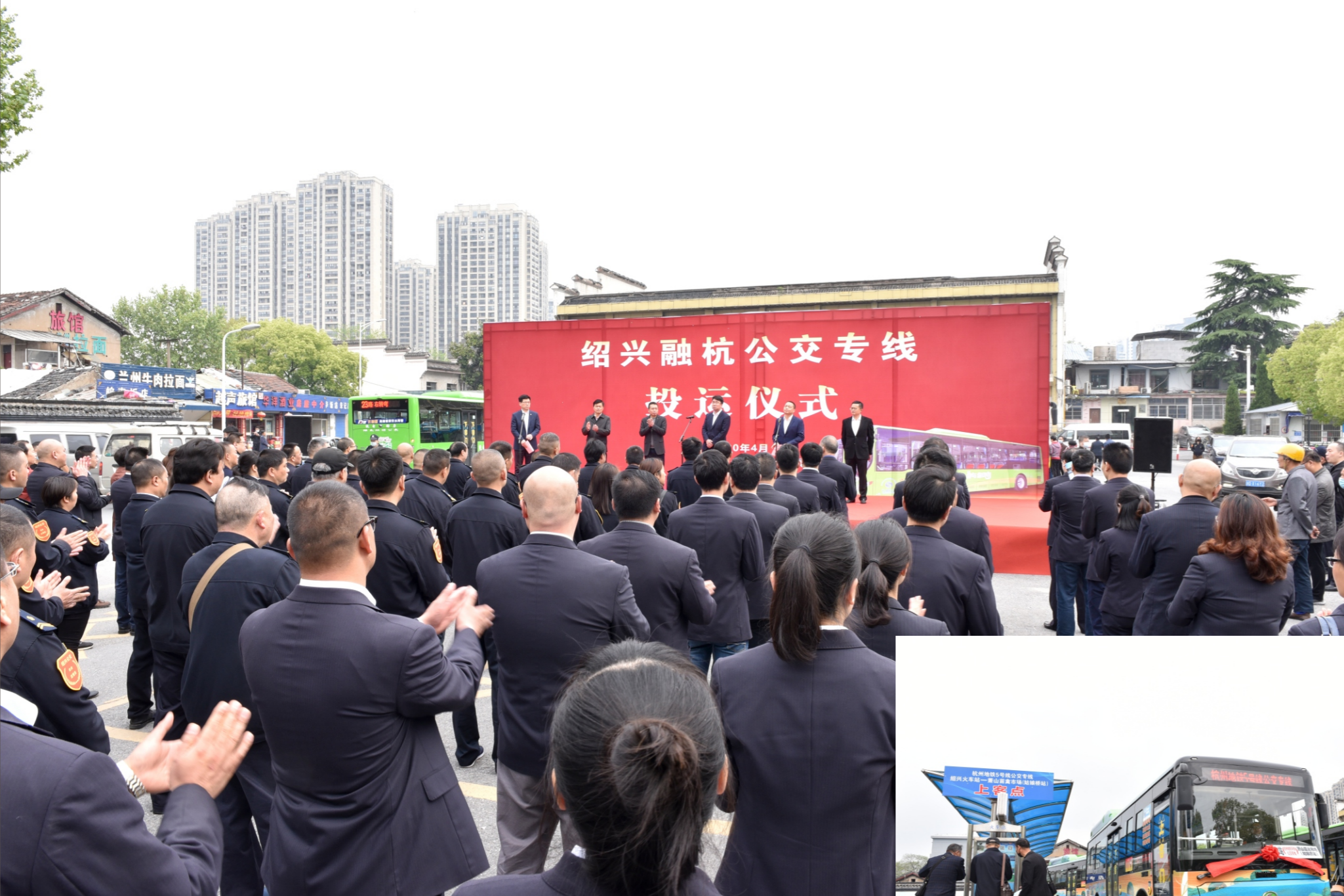
绍兴融杭公交专线投运仪式