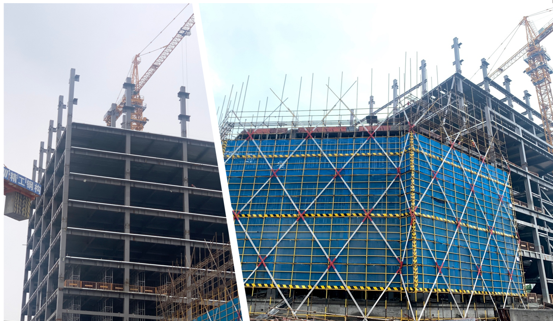
南部综合枢纽施工现场

截至4月底，杭绍台高速公路绍兴金华段项目累计完成投资233.51亿元，其中当年完成投资额16.63亿元，总体形象进度至79.7%，三至十标土建工程总体形象进度完成至99%；房建工程总体形象进度50%；交安工程总体形象进度65%；智慧高速机电工程总体形象进度50%。