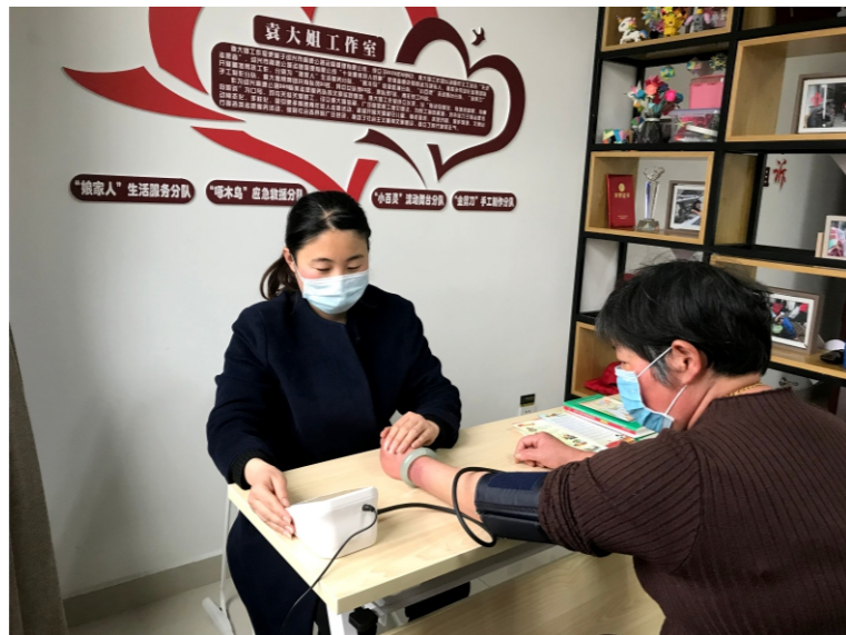
袁大姐工作室人员帮扶群众