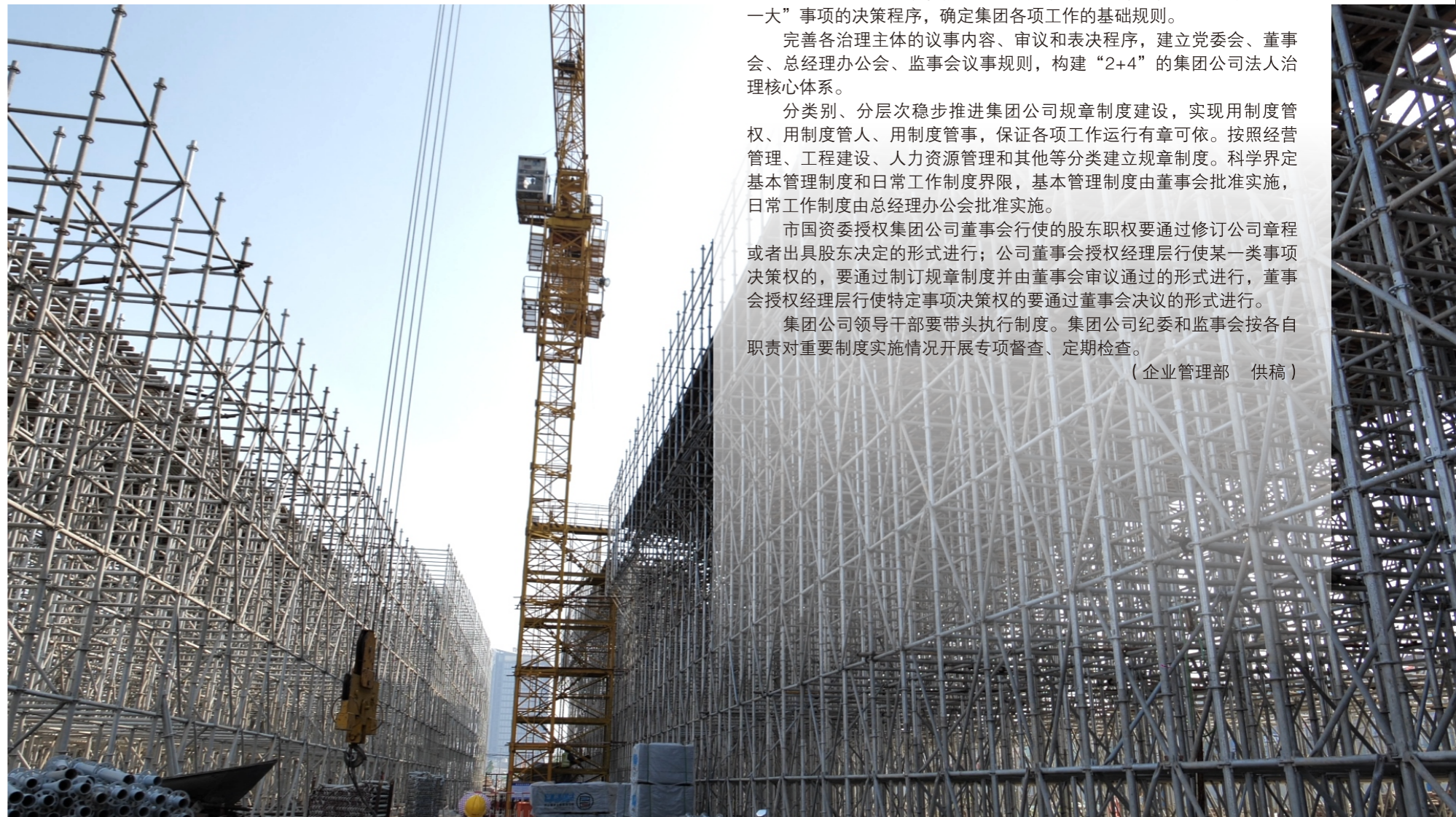
杭绍台一标施工现场