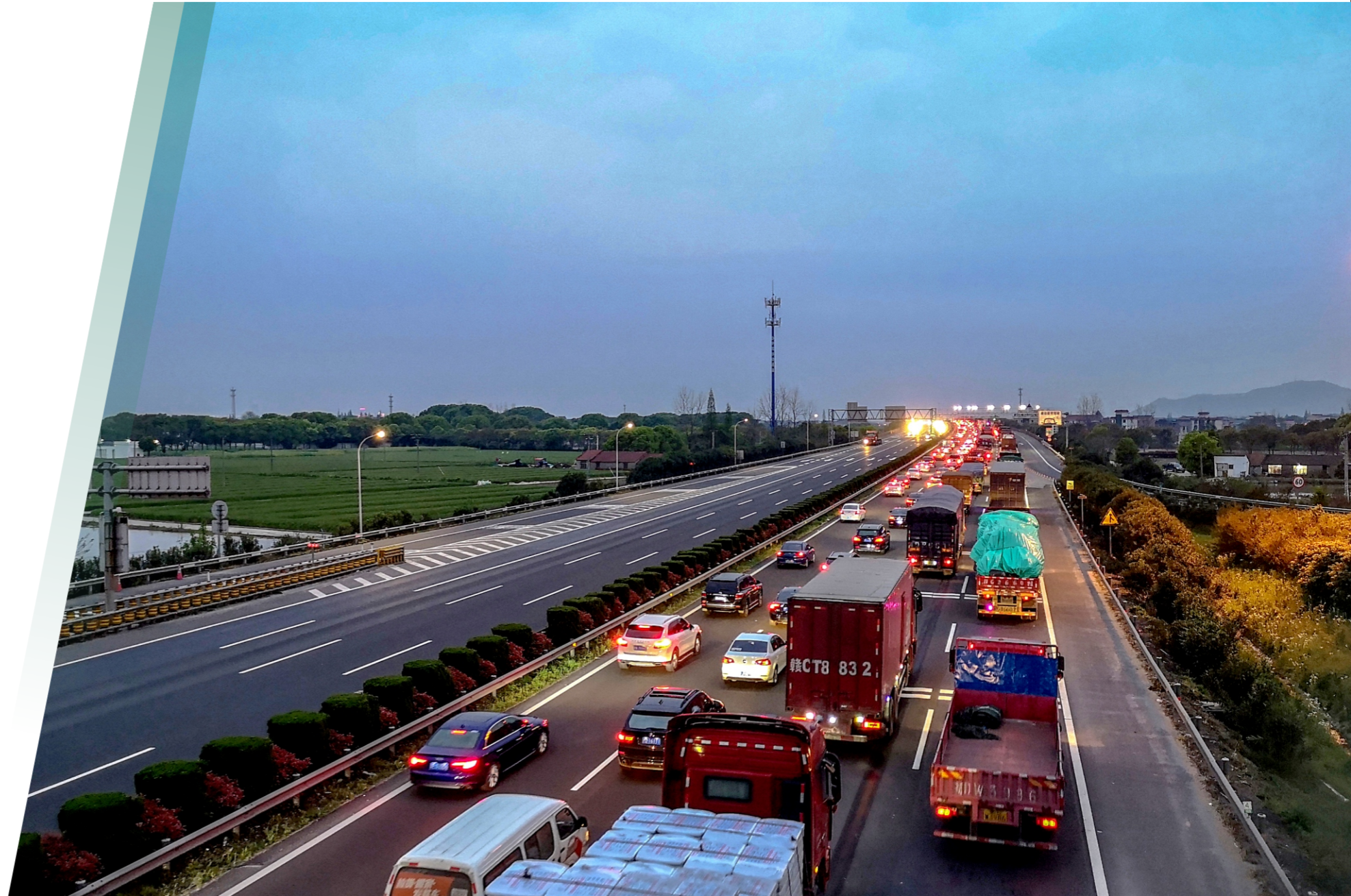
免通期间，所辖高速主线日均流量超10万两次，累计减免通行费约2.3亿元

一、免通不免责，全力以赴做好安全保畅。绍兴高速全力打造高速铁军，不断强化安全管理队伍建设，对安管队伍实行半军事化管理，保畅施救工作实行“133315”工作机制。做到严格人防，落实专人开展“治超”“行人上高速”等管控劝返，强化管控力度，免通以来已劝返行人上高速102人次，入口治超劝返336辆次；巩固物防，开展路域巡查整治，整改维护重点路段、要害区域安全防护提示设施，开展主线巡道124560公里，维护更换隔离栅507米、隔离立柱106根、安全