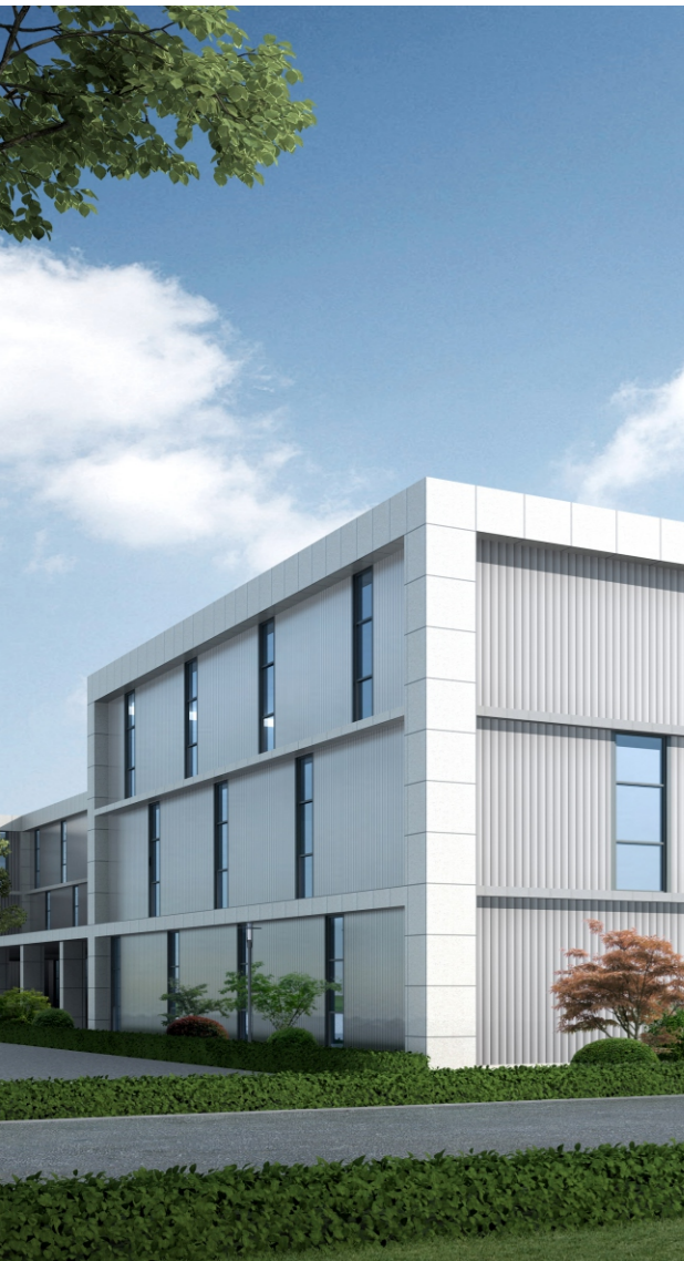
绿色循环建材生产基地效果图