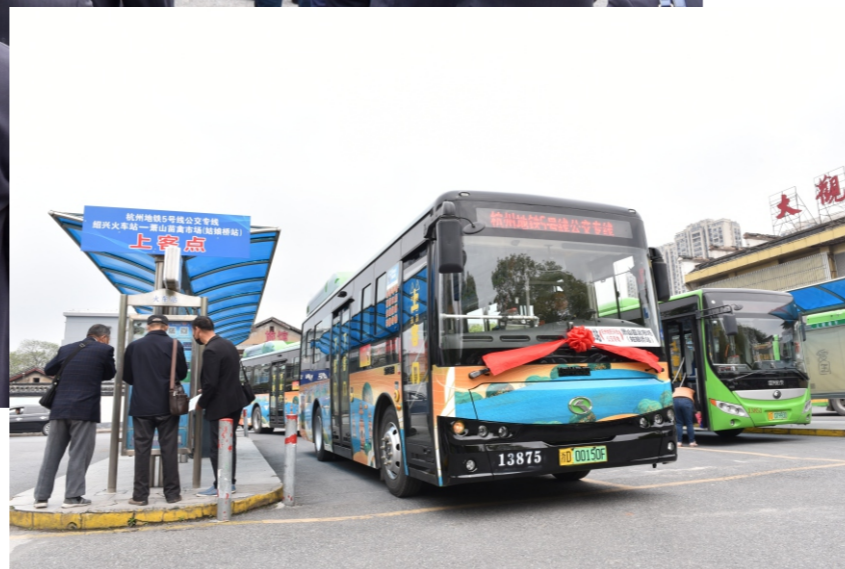
融杭公交火车站上客点