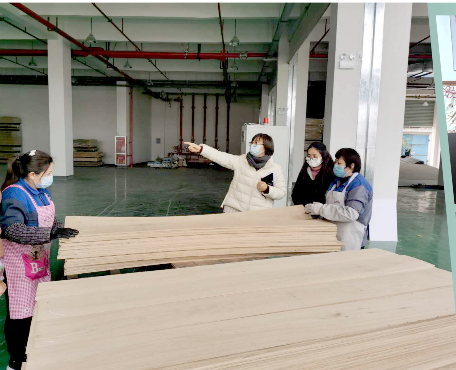
驻企服务员现场指导