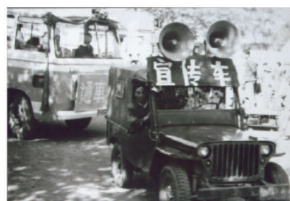
1979年10月1日，绍兴公交首条线路1路车通车典礼现场