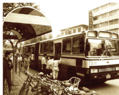
80年代的绍兴公交车、站客及解放路街景

地的变化。自首批80辆清洁能源公交车投放以来，绍兴公交积极打造低碳、高效、大容量的公共交通系统，加快新技术、新能源、新装备的应用，宽敞、舒适、环保的公交车穿梭在市区每一条道路。包括纯电动在内的新能源、绿色环保公交车比重达到83.25%。公交站台更趋新颖、设计更加人性化，核心区域站点候车亭建成率95%，便民座椅安装率98%。场站等配套设施建设力度不断加大，会稽路、清水闸，平水、稽东、道墟和包括镜湖、孙端、梁湖、小越在内的一批综合停车场、枢纽站、首末站相继建成启用或正在建设之中，到2021公交场站将达到95个，总面积987亩，为公交线网的布设、线路优化提供了有力的基础保障。