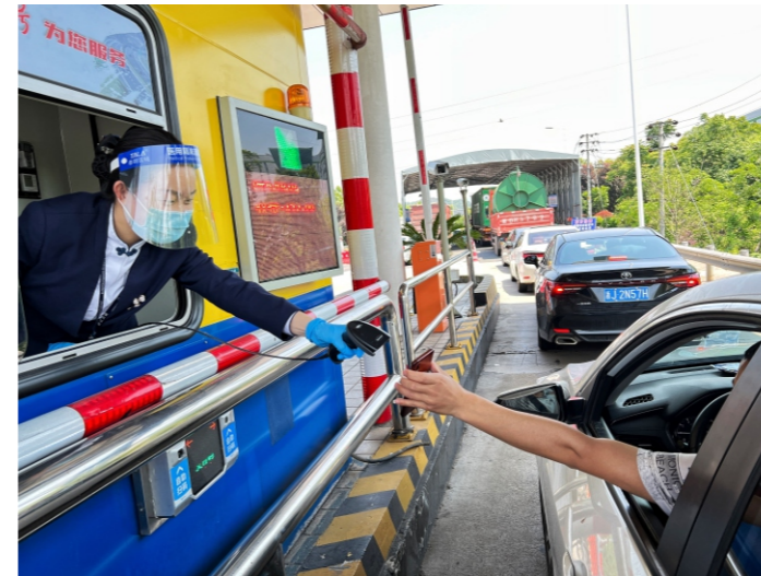
裘杭曼窗口热情服务过往司乘